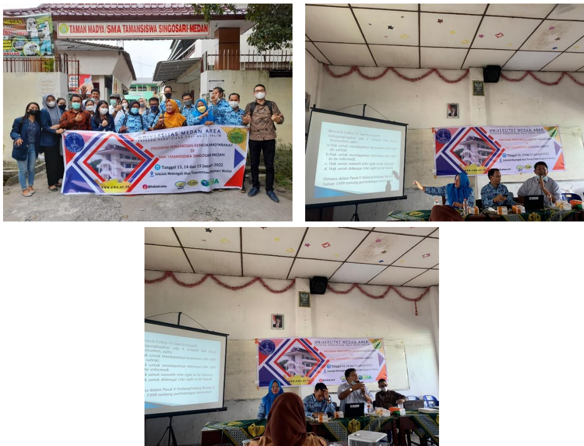
Gambar 1. Kegiatan tim dalam pelaksanaan Pengabdian

Pelaksanaan pengabdian kepada masyarakat ini dilaksanakan oleh Lembaga Penelitian dan Pengabdian Kepada Masyarakat Universitas Medan Area (LP2MP UMA) selama tiga hari, hari pertama yaitu survey lapangan dengan kunjungan ke desa ini yang dilakukan oleh team LP2M. Hari kedua yaitu visitasi seluruh team PKM ke Lokasi dan penandatanganan MOU antara Kepala sekolah Taman Madya (SMA) Taman Siswa Singosari dengan UMA serta sosialisasi ke Para Guru Dan Siswa Taman Madya (SMA) Tamansiswa Singosari warga tentang pentingnya Mengetahui Apa Yang Menjadi Hak Hak Konsumen. Hari ketiga adalah pengumpulan data oleh team PKM dan pembuatan laporan pelaksanaan. Pelaksanaan pengabdian Dan Sosialisasi di Taman Madya (SMA) Taman Siswa Singosari didapatkan informasi langsung mengenai Ketidaktahuan Para Guru Dan Siswa Taman Madya (SMA) Tamansiswa Singosari Akan Apa yang Menjadi Hak Konsumen, Kewajiban Konsumen, Kewajiban Pelaku Usaha, Larangan Bagi Pelaku Usaha